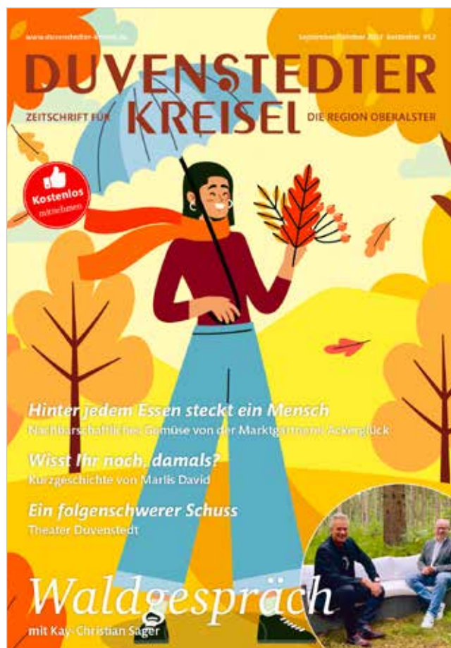
(Titelblatt der letzten Ausgabe)