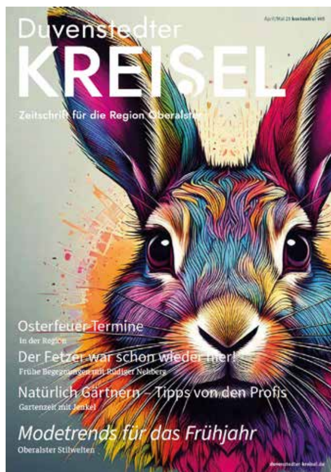
(Titelblatt der letzten Ausgabe)