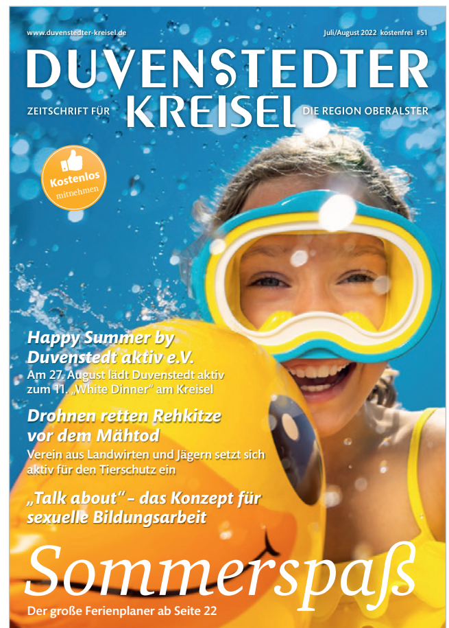
(Titelblatt der letzten Ausgabe)